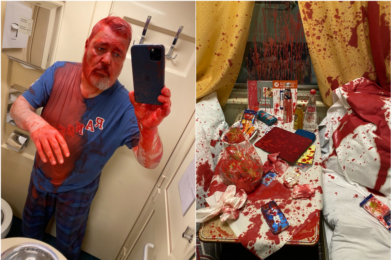
Главного редактора «Новой газеты» и лауреата Нобелевской премии мира Дмитрия Муратова облили красной краской в вагоне поезда, сообщается в Telegram-канале редакции Novaya Gazeta. Europe. 7 04 2022